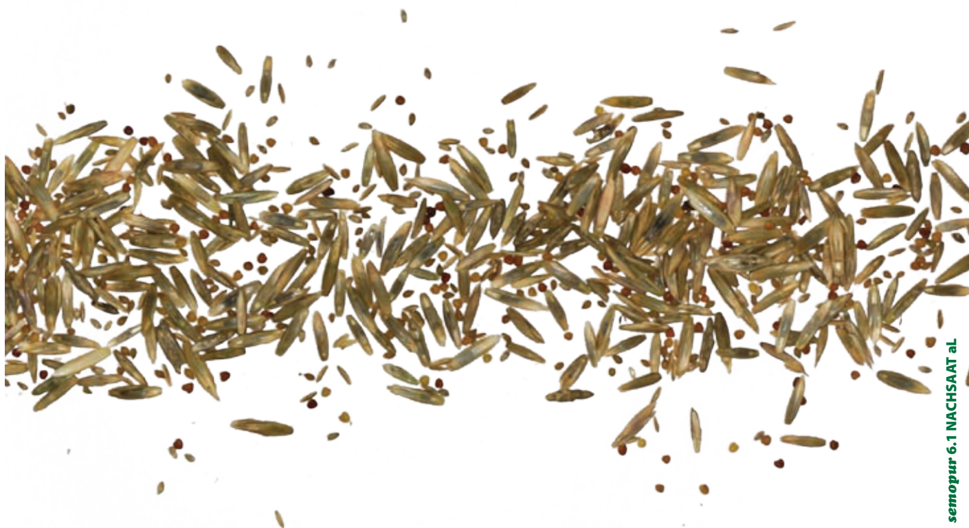
semopur 6.1 NACHSAAT al